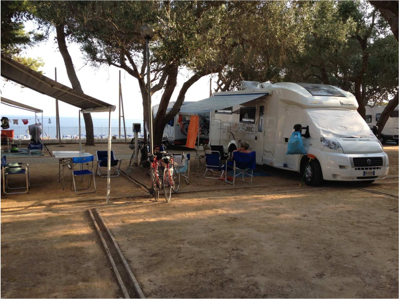
03 settembre 2015 Santa Cesarea Terme camping Porto Miggiano