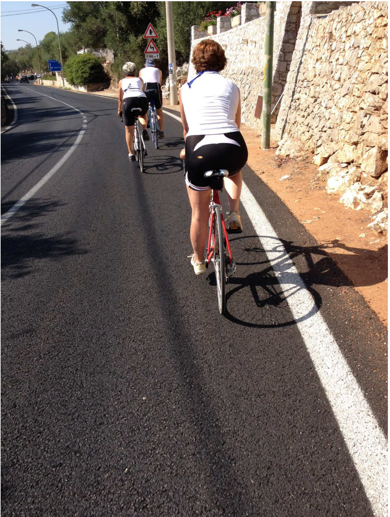
04 settembre 2015 Santa Cesarea Terme in bici sulla litoranea verso S.Maria di Leuca