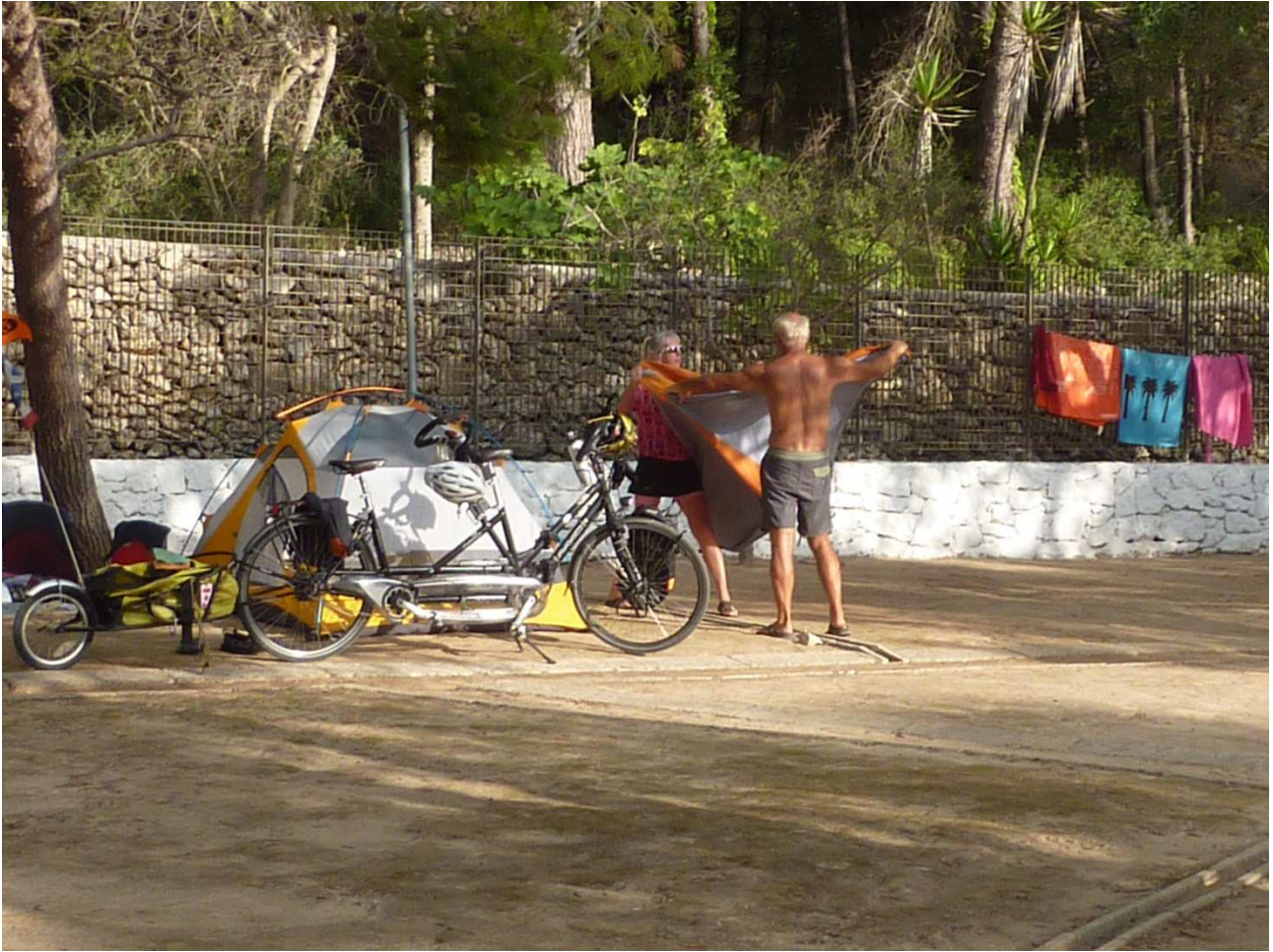
05 settembre 2015 Santa Cesarea Terme i nostri pedalatori stanno preparandosi a partire. Fra un paio d'ore li ritroveremo a Santa Maria di Leuca, noi in camper ..... Loro in bici. FANTASTICI.