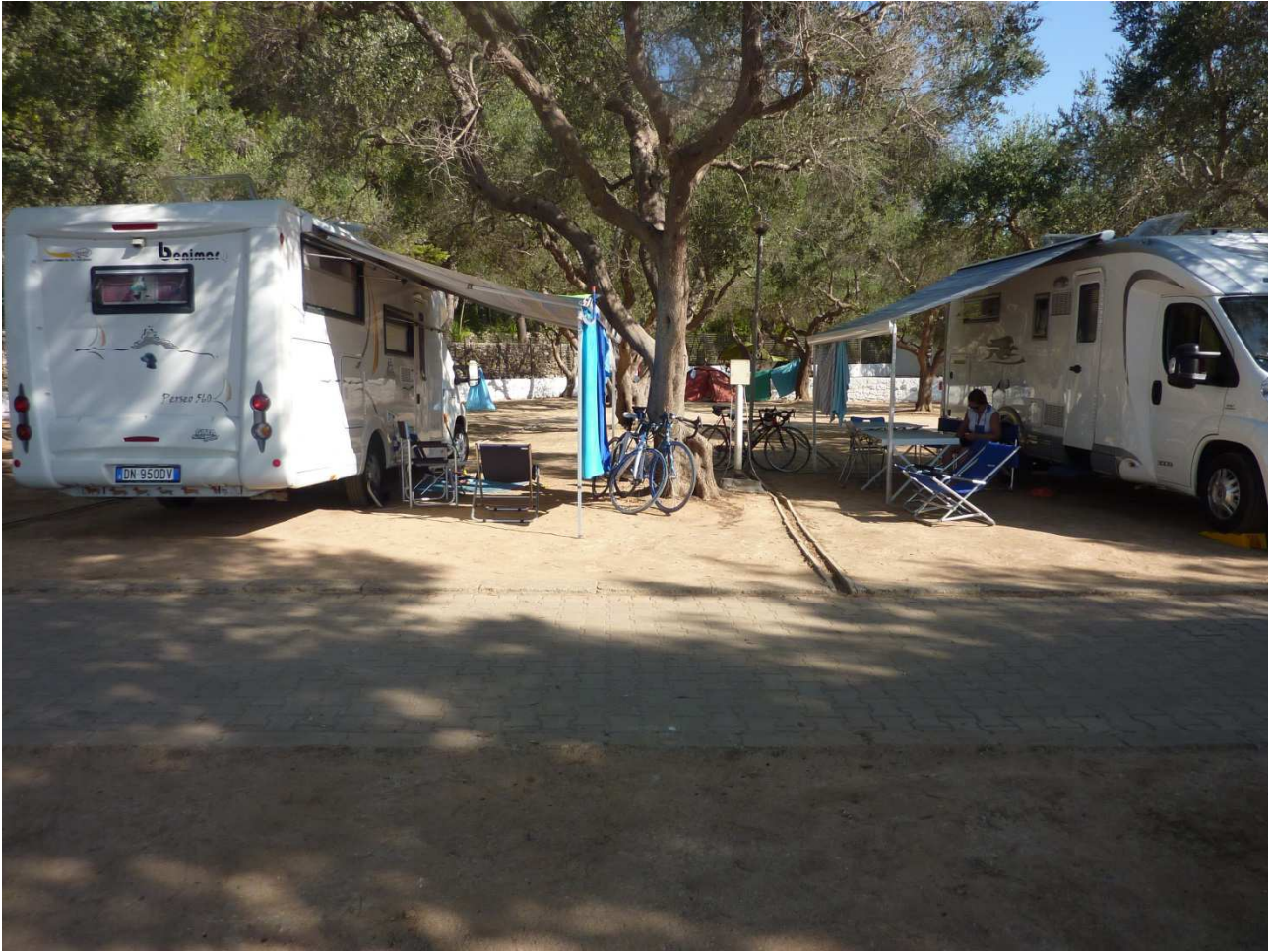
04 settembre 2015 Santa Cesarea Terme vita in campeggio