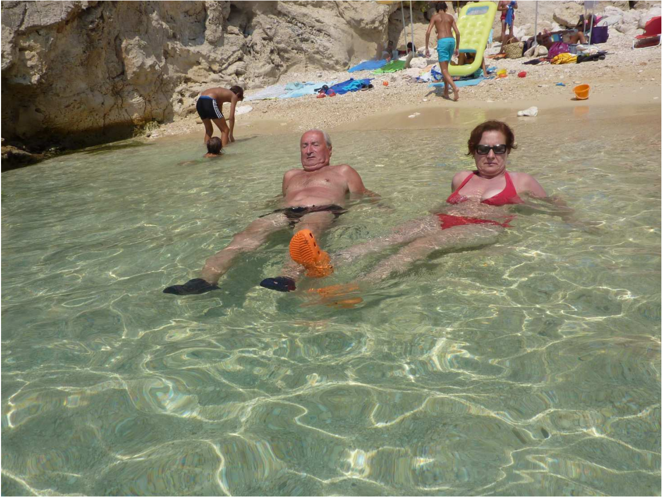
03 settembre 2015 Santa Cesarea Terme a mollo