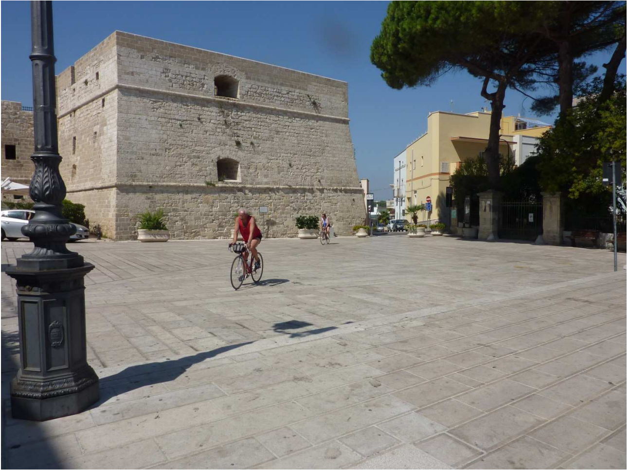
04 settembre 2015 Santa Cesarea Terme pedalando (in salita) arriviamo a Castro