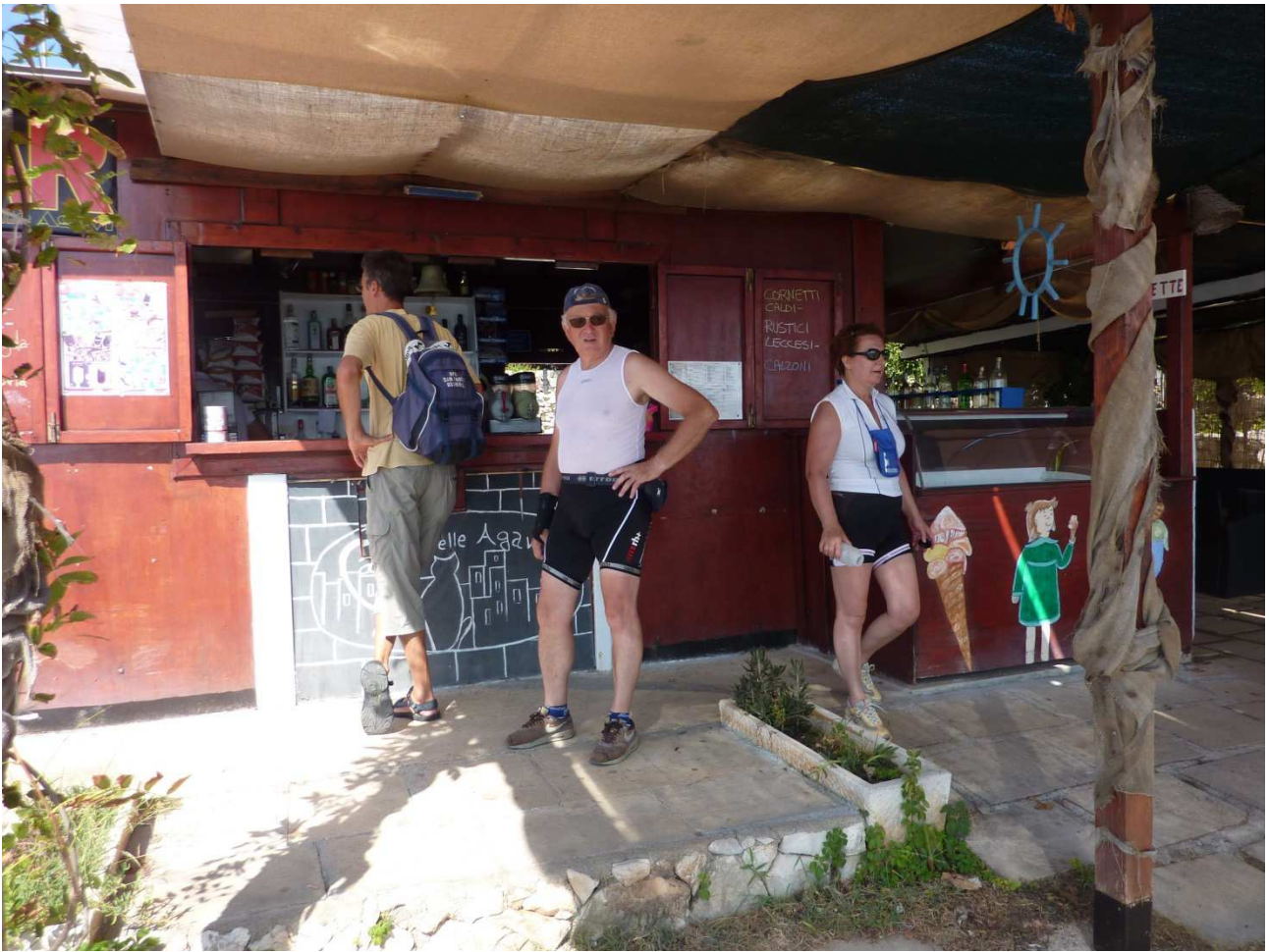
04 settembre 2015 Santa Cesarea Terme una pausa bar durante un'escursione in bici sulla litoranea verso Santa Maria di Leuca