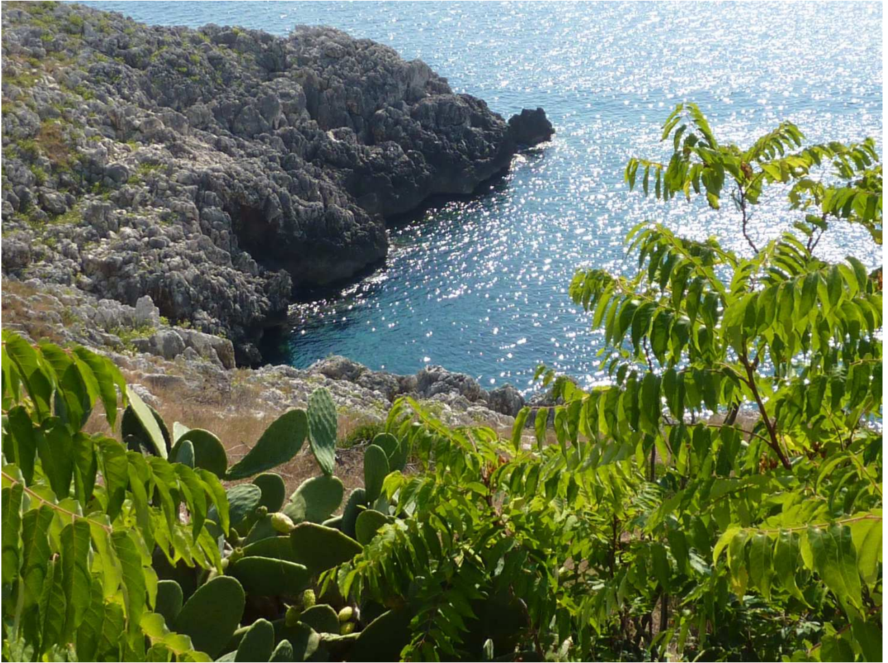
03 settembre 2015 Santa Cesarea Terme vista dalla strada per Otranto