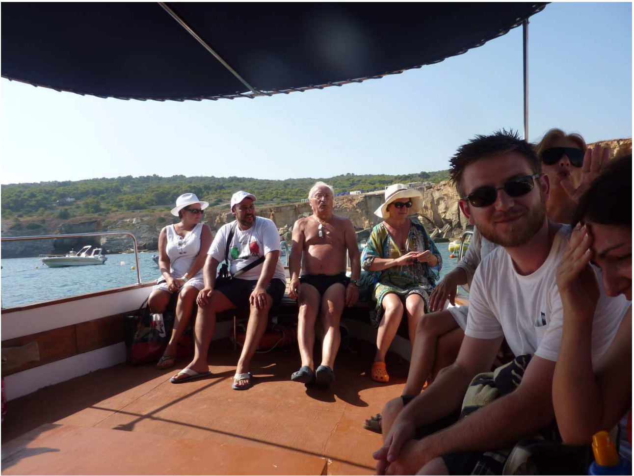
04 settembre 2015 Santa Cesarea Terme sul barcone per il giro turistico alle varie grotte marine