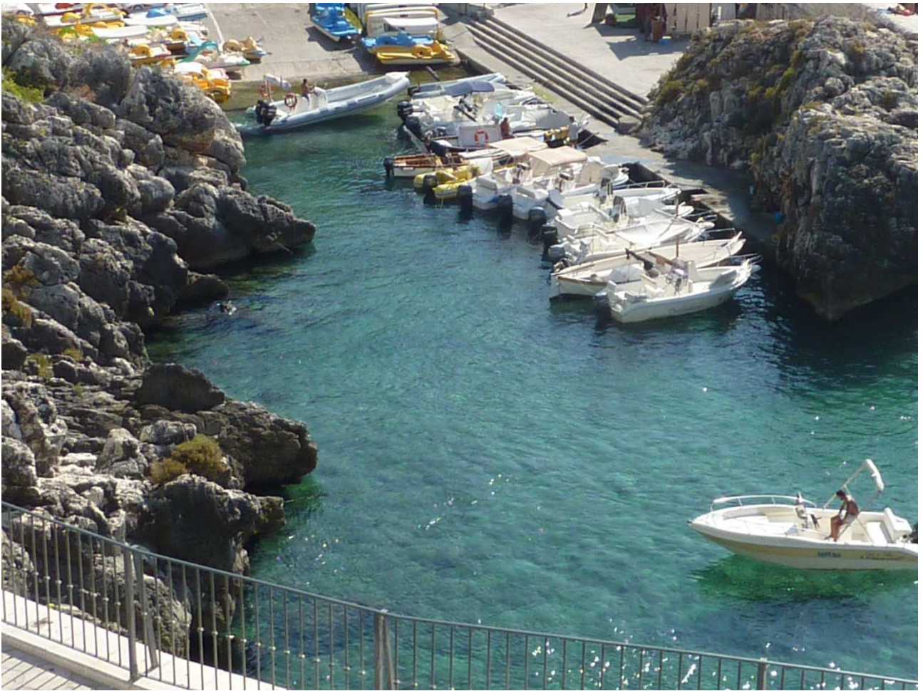
04 settembre 2015 Santa Cesarea Terme il porticciolo