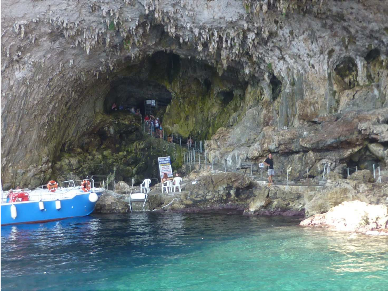
04 settembre 2015 Santa Cesarea Terme dalla barca che ci porta a spasso