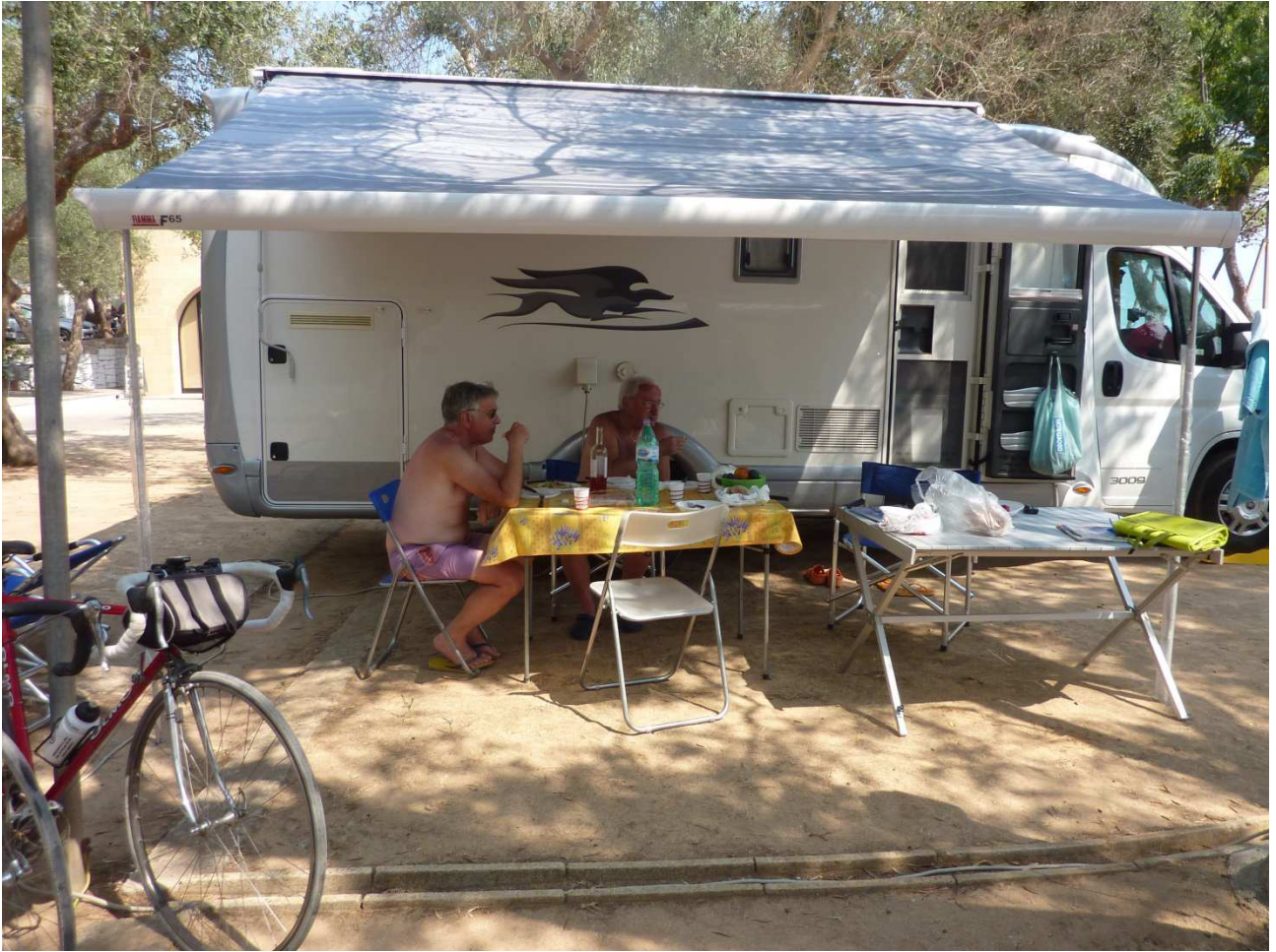
04 settembre 2015 Santa Cesarea Terme vita in campeggio