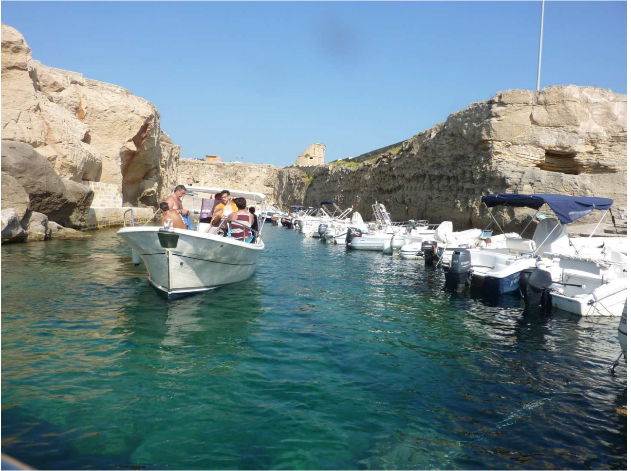
04 settembre 2015 Santa Cesarea Terme dalla barca che ci porta a spasso