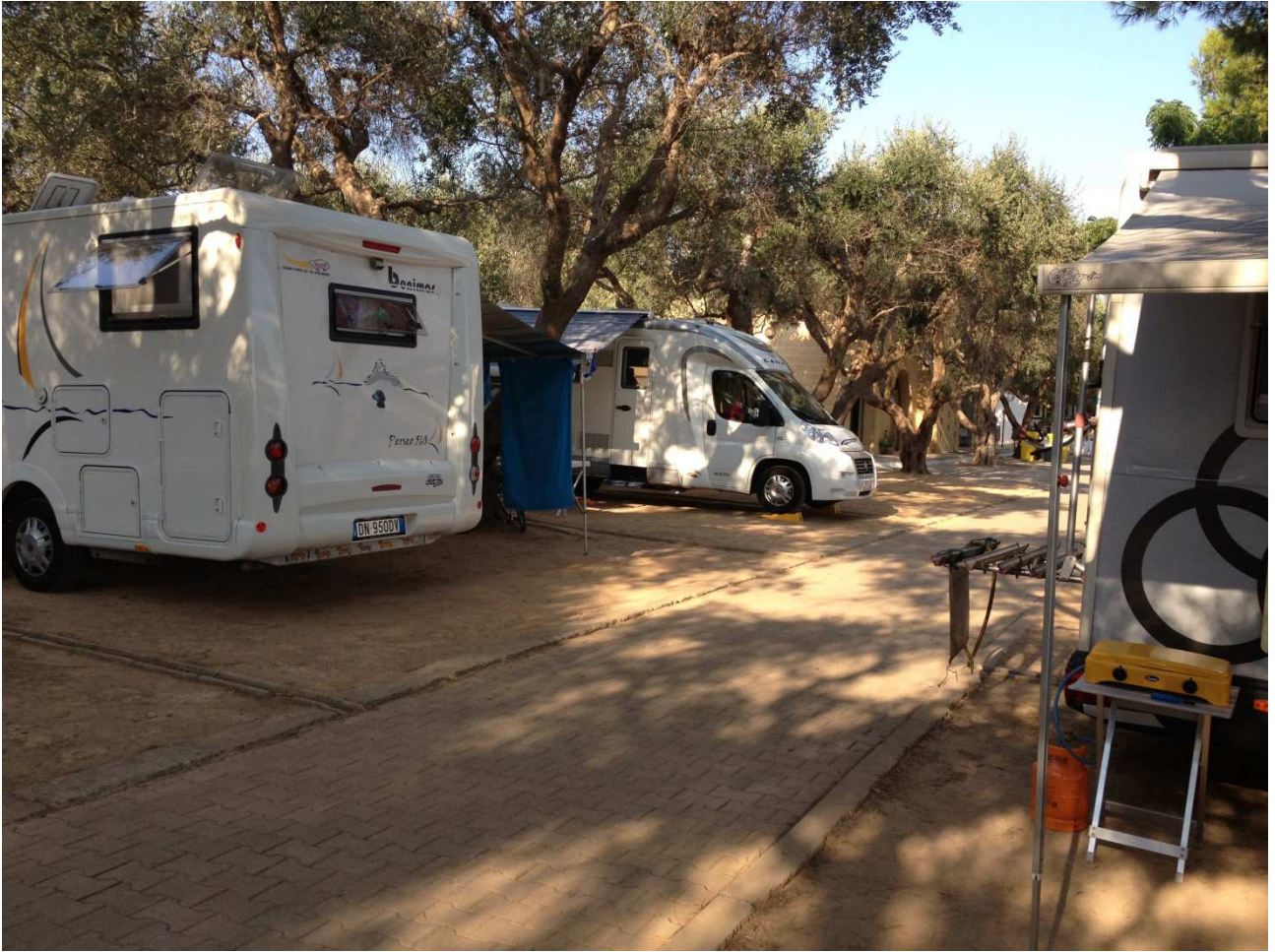
03 settembre 2015 Santa Cesarea Terme camping Porto Miggiano