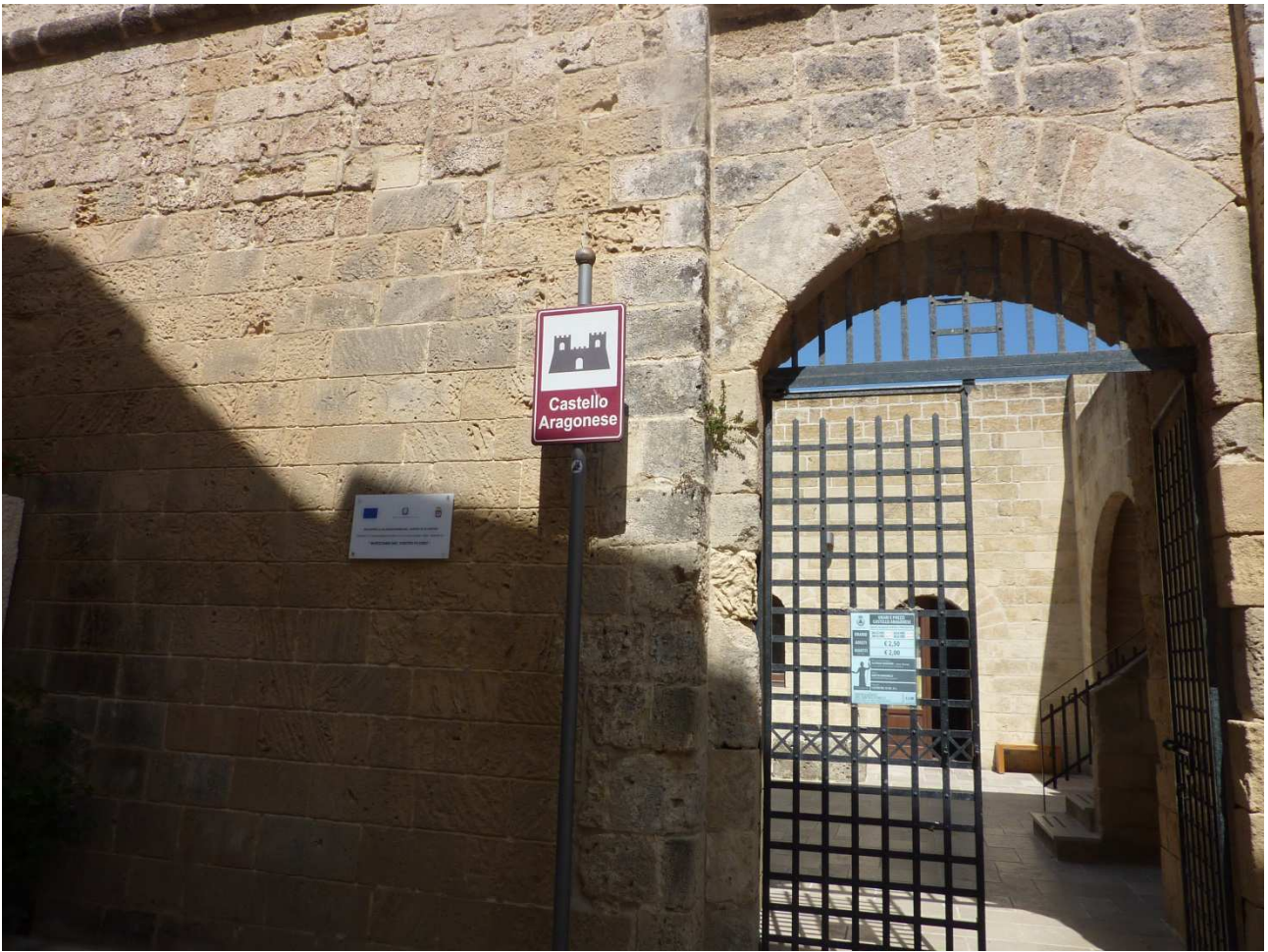
04 settembre 2015 Castro ..... castello Aragonese