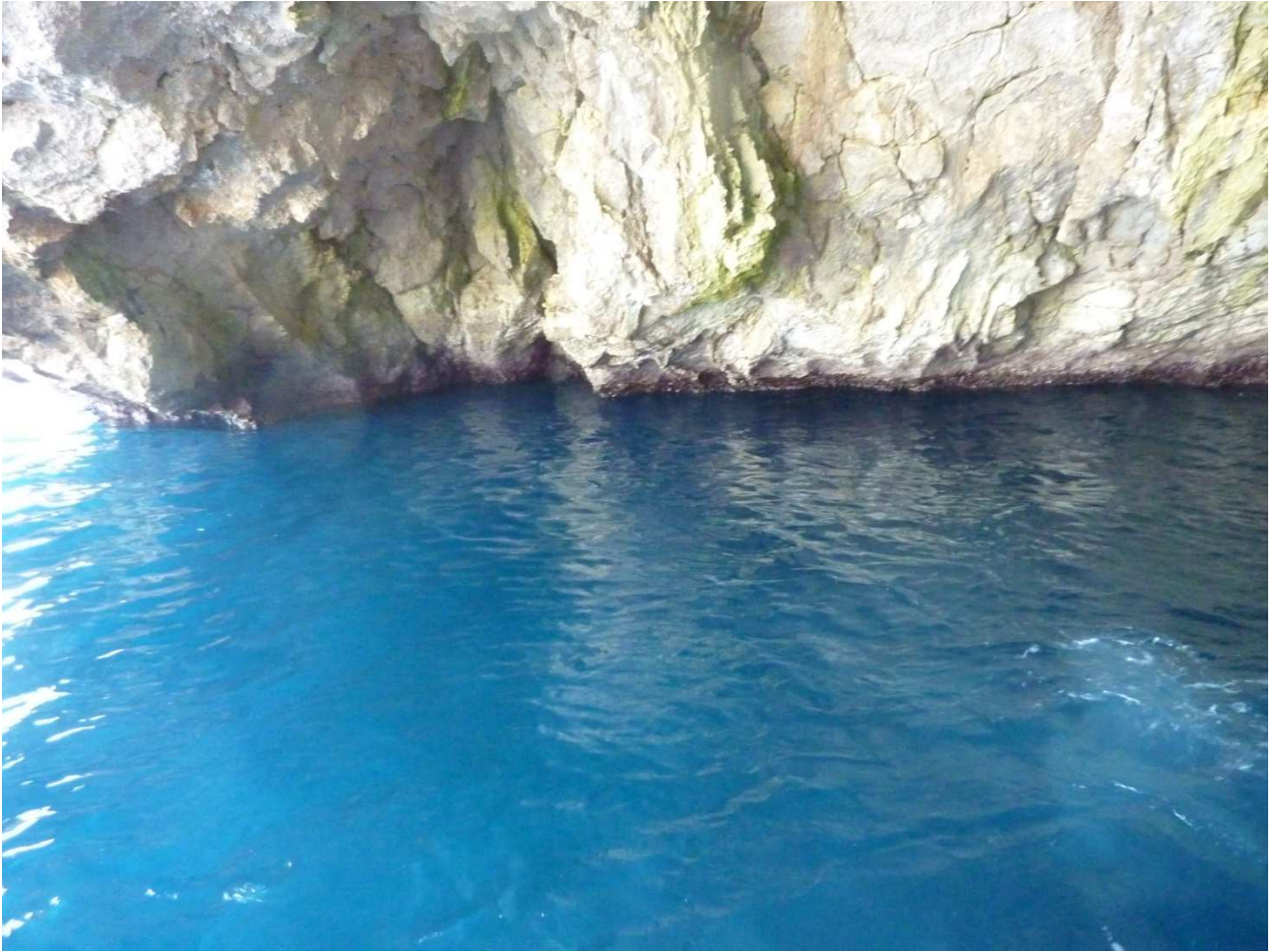
04 settembre 2015 Santa Cesarea Terme dalla barca che ci porta a spasso