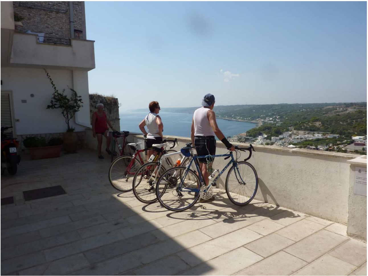
04 settembre 2015 Castro ..... belvedere