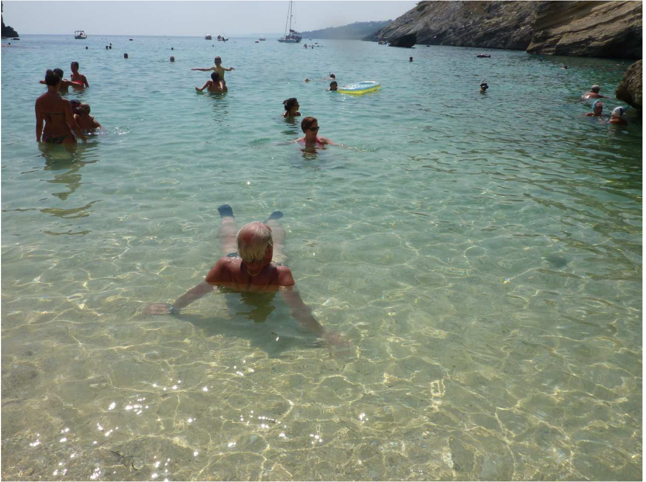
03 settembre 2015 Santa Cesarea Terme a mollo